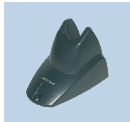
Supporto STD Heron™ "Hands-Free"