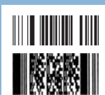
Codici RSS &amp; PDF417